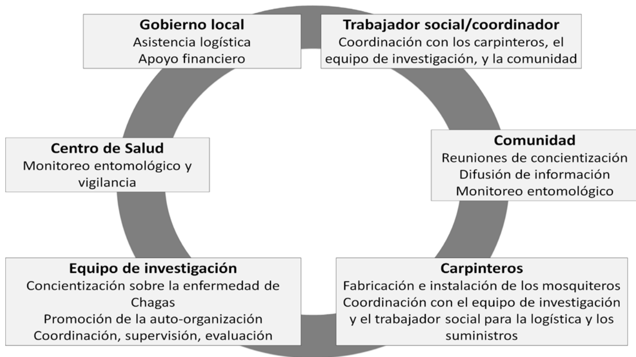
Figura 2. Principales actores involucrados en la implementación de la intervención de control vectorial y sus actividades asociadas. Diferentes estrategias para la implementación fueron discutidas en un proceso iterativo durante varias reuniones, hasta que los actores llegaron a un acuerdo sobre lo que percibían como la mejor estrategia de implementación. Cada actor mantuvo un papel diferente en la implementación y fue responsable de actividades específicas indicadas en cada cuadro.

local. Los carpinteros fueron identificados por la comunidad junto con el gobierno local, y estuvieron de acuerdo en construir e instalar los mosquiteros. Los carpinteros se organizaron con cada familia para visitar su casa y medir las ventanas. El diseño de los mosquiteros incluía una malla de fibra de alta calidad con un marco en madera hecho a las dimensiones de cada ventana ( Figura 3 ). La madera se compró de vendedores locales autorizados quienes vendieron a precio de mayoreo y llevaron el material hasta los pueblos. Los carpinteros también se pusieron de acuerdo con las familias para la entrega y la instalación de los mosquiteros. Una vez que el plan de instalación estuvo en marcha, el equipo de investigación tuvo un papel menor en la coordinación de la intervención; el liderazgo se transfirió de forma eficiente a los gobiernos locales, los trabajadores