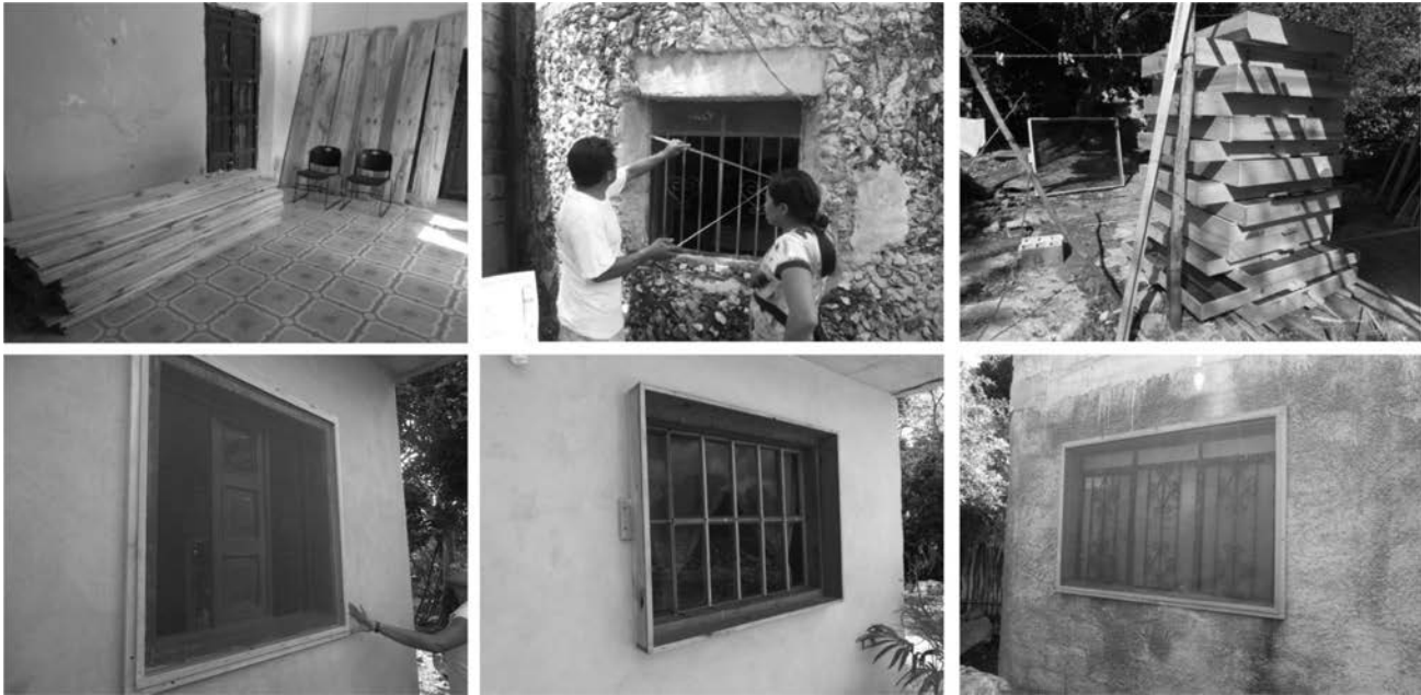
Figura 3. Fabricación e instalación de los mosquiteros para el control vectorial. Todos los mosquiteros fueron construidos en las comunidades, utilizando una malla de fibra de alta calidad con un marco de madera hecho a las dimensiones de cada ventana del cuarto.

esta intervención de ecosalud en términos de infestación de las casas, así como las percepciones de los diferentes actores sobre la intervención, los potenciales cambios en su percepción de los triatomíneos, de la enfermedad de Chagas y del concepto de control vectorial.