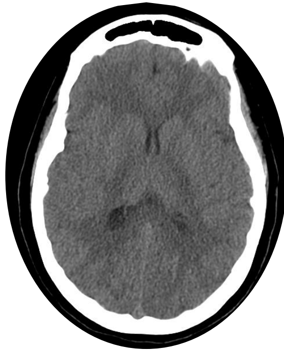
Imagen 1: TAC de cráneo simple que demuestra la ausencia de eventos isquémicos y hemorrágicos.