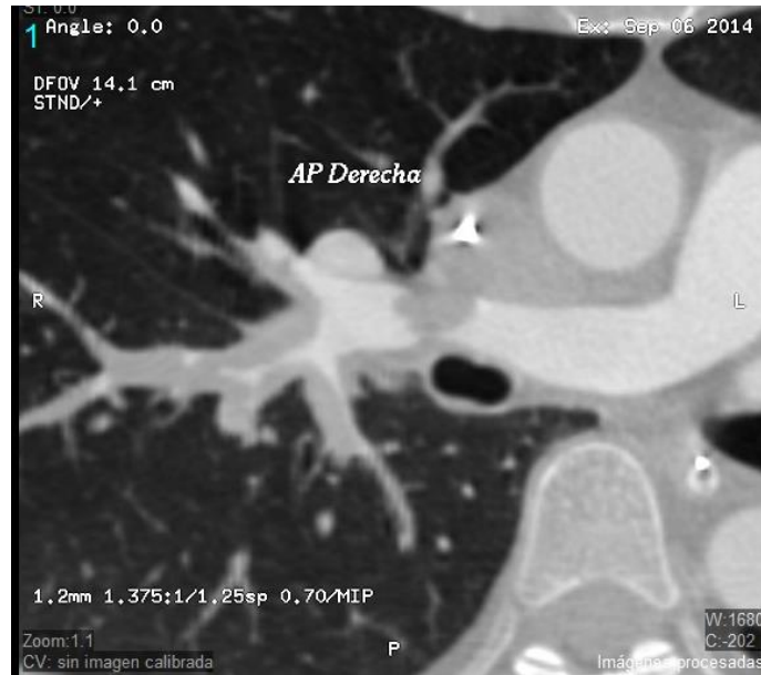
Imagen 3: AngioTAC pulmonar que demuestra trombosis de la arteria pulmonar derecha de primero y segundo orden.