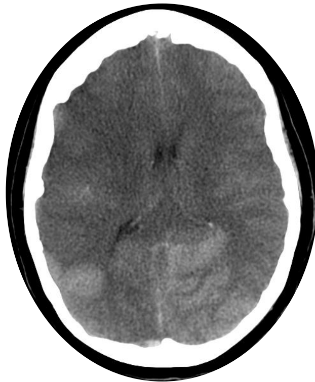
Imagen 4:TAC de cerebro simple que demuestra borramiento de surcos y circunvoluciones, se observan múltiples áreas de hipodensidad de forma difusa de predominio hacia el hemisferio derecho así como imágenes hiperdensas debido a sangrado parenquimatoso de predominio hacia el lóbulo parietal derecho y ambos lóbulos occipitales.